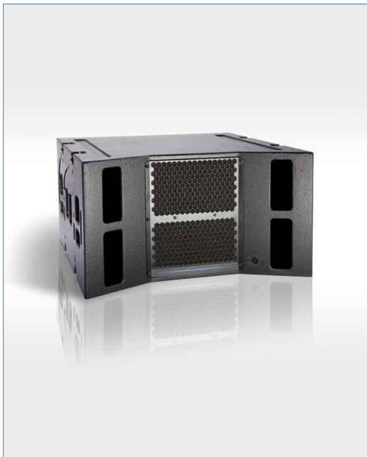
Enceinte de basse UNILINE UL115B

Le modèle UL115B est l'enceinte de basse dédiée du système "line array" APG UNILINE. L'ergonomie a été étudiée afin que la manipulation, le transport et l'accroche des enceintes s'effectuent de la manière la plus aisée et sécuritaire. Le système de liaison mécanique en 4 points est prévu pour les configurations cardioïdes qui nécessitent de retourner une ou des enceintes au sein d'un réseau vertical ou horizontal. Le système mécanique autorise tous les types d'installation : levage de grappes simples des différentes enceintes, de grappes combinant UL115B et UL210/D, groupes simples ou combinés d'enceintes posées.